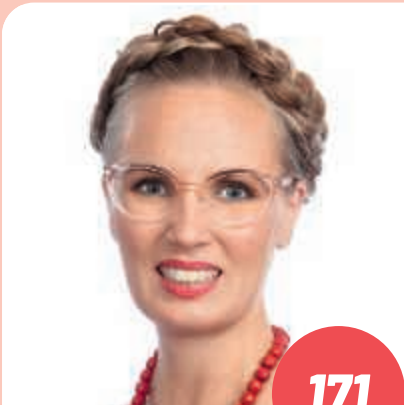
Ikä: 44 yliopettaja, terveystieteiden tohtori, TURKU

Veisin eduskuntaan työelämän vahvaa asiantunte- musta - tavoitteena reilumpi työelämä. Lähtökohdistani ja työni vuoksi tiedän, että sosiaaliturva ja julkiset palvelut (mm. päivähoito, koulut, terveydenhoito, vanhus- tenhoiva) ovat tavallisen ihmisen arjen turvana. Niitä ei saa vaarantaa. Myös Saaristomeremme suojelu vaatii panostuksia, jotta se säilyisi tuleville polville.