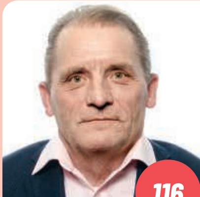
Ikä: 59 rakennusammattimies, pääluottamusmies KURIKKA