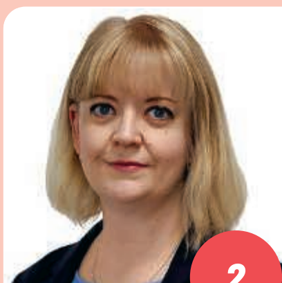
Ikä: 42 lähihoitaja, tradenomi MÄNTTÄ-VILPPULA

Sosialidemokratia on oikeudenmukaisuutta ja tasa-arvoa, huolenpitoa ja vastuullisuutta. Pirkanmaalaisen pääministerin johdolla haluamme jatkaa työtä sen puolesta, että huomenna olisi paremmin kuin tänään. Siksi sinunkin kannattaa äänestää sosialidemokraatteja Pirkanmaalla!