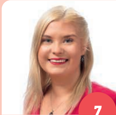
Ikä: 24 poliittinen avustaja, hallintotieteiden kandidaatti, TAMPERE