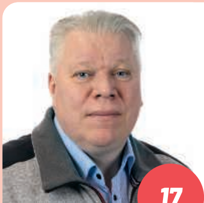
Ikä: 55 myyjä KITILÄ

Annetaan Lapin äänen kuulua ja vaikuttaa. Lapin ja kuntien elinvoimasta on pidettävä huolta. Ihmisten palvelut on turvattava myös asutuskeskusten ulkopuolella ja pitkien etäisyyksien päässä. Monipuolinen elinkeinorakenne auttaa turvaamaan palvelut koko Lapissa. Tule mukaan! Haluan, että Lappi on meidän kaikkien yhteinen paikka.