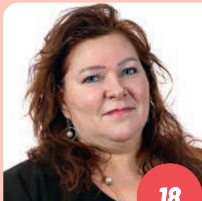
Ikä: 54 laitoshuoltaja, lähihoitajaopiskelija POSIO