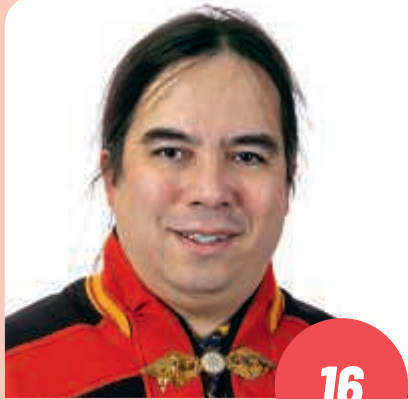
Ikä: 43 lastenohjaaja UTSJOKI