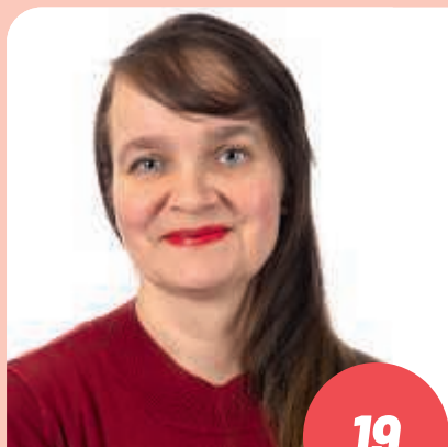
Ikä: 45 myyjä SODANKYLÄ

Työssäoppiminen on parasta oppimista ja sitä kautta nuori voisi päästä helpommin työelämään kiinni. Samalla työssä jaksaa pidempään, kun saa opastaa ja neuvoa uutta työntekijää. Näin voitaisiin lisätä työllisyyttä helppoilla keinoilla. Työelämässä tärkeitä on, että tehtävänkuva olisi oikea ja järkevä. Työnantajan täytyy sitouttaa työntekijä työhön vakinaistamalla ja tarjoamalla kunnolliset työehdot. Näin sairaslomat lyhenisivät ja työn kuormittavuus pienenis. Näiden asioiden puolesta haluan puhua eduskuntavaaleissa. Muista äänestää!