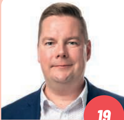
Ikä: 45 hoitotason ensihoitaja, luottamusmies, aluevaltuutettu JYVÄSKYLÄ