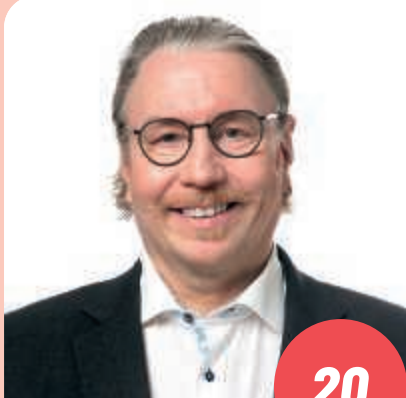
Ikä: 56 linja-autonkuljettajien päälouottamusmies, kaupunginvaltuuston puheenjohtaja, JYVÄSKYLÄ

Kansanedustajana haluan taata meille kaikille paremmat, ihmisläheisemmät ja kustannustehokkaammat palvelut. Kun ajat ovat haastavat, tarvitaan päättäjiksi asiansa tuntevia ammattilaisia, jotka ovat kansalaisten pulssilla päivittäin ja jotka elvyttävät ja hoitavat haastaviakin yhteiskunnallisia asioita, ja joihin voit luottaa aina tiukimmissakin tilanteissa. Hoida sinä minut eduskuntaan.