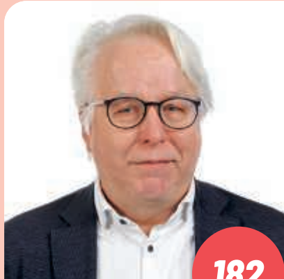
Ikä: 69 Oikeustieteen tohtori, varatuomari, oikeushistorian emeritusprofessori

Olen 65-vuotias teologian tohtori, ex-piispa ja ex-kansanedustaja (2007–2019). Olin SDP:n varapuheenjohtaja 2008–2012. Tuon eduskuntatyöhön etiikan alan asiantuntemukseni sekä kykyni yhteistyöhön. Minua innostaa mahdollisuus tehdä työtä ihmisoikeuksien, oikeusvaltion ja demokratian sekä kestävä ympäristön edistämiseksi. Tulevalla vaalikaudella edessä on hankalia valintoja. Nämä valinnat vaativat vahvaa eettistä arviointia. Ratkaisut nousevat puolueiden tunnustamista arvoista. Arvoilla on väliä.