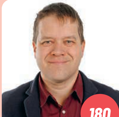
Ikä: 47 Kaupunginvaltuutettu, poliittisen historian dosentti