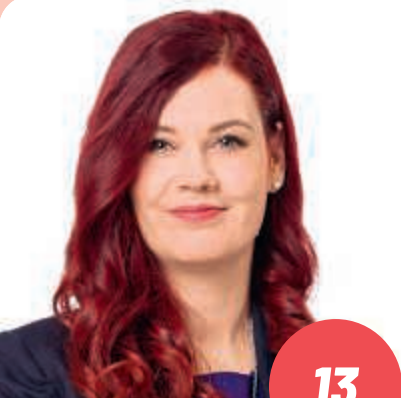
Ikä: 34 hallintotieteiden maisteriopiskelija JANAKKALA

Olen 49 v. ministeri, kansanedustaja ja lakimies Lahdesta. Perheeseeni kuuluu liikunnanohjaajavaimo, sekä kolme lasta, 20v, 18v ja 13v sekä kaksi jack-russellinterrieriä Osku 5v ja Oona 2v. Eduskunta-vaaleissa päätetään tulevaisuuden Suomen suunnasta ja millä arvoilla Suomea johdetaan ja rakennetaan. Rinteen ja Marinin hallitukset ovat kriiseistä huolimatta onnistuneet useissa tavoitteissaan. Työllisyysasteemme on parempi kuin koskaan, sosiaali- ja terveyspalveluiden uudistaminen on edennyt ja tavoite hiilineutraalista Suomesta vuonna 2035 on toteutuksessa. Tähän maailmantilanteeseen tarvitsemme turvallisuutta, kokemusta ja luottamusta. Suomi on ollut menestystarina ja tehtävämme on varmistaa, että se on sitä myös jatkossa. Tervetuloa mukaan rakentamaan parempaa Suomea ja kestävämpää yhteiskuntaa. Meidän yhteistä tekemistämme tarvitaan nyt enemmän kuin koskaan!