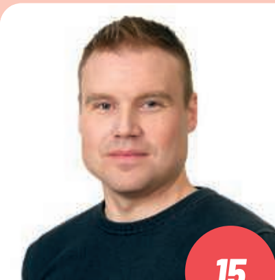
Ikä: 40 sulattaja, kaupunginhallituksen jäsen HÄMEENLINNA

Teatteri, taide, kirjallisuus, elokuvat, pelit ja kaikki muut kulttuurin muodot antavat jokaisen elämään tärkeää sisältöä ja henkistä hyvinvointia. Kulttuuri myös työllistää usein suuren joukon ihmisiä varsinaisen teoksen ympärille. Monipuolinen ja laadukas koulutus yhdessä elävän kulttuurin kanssa luovat maahamme menestyksekkään ja innovatiivisen toimintaympäristön.