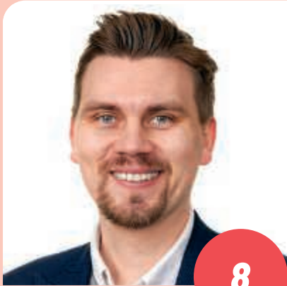
Ikä: 30 yhteiskuntatieteiden kandidaatti, työmies IITTI