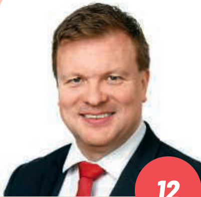
Ikä: 48 ministeri, kansanedustaja, lakimies (Master of Laws) LAHTI