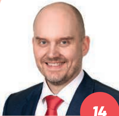
Ikä: 47 tietotekniikan insinööri (AMK) ORIMATTILA